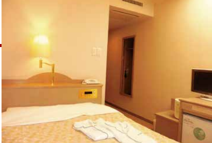
セミダブルルーム