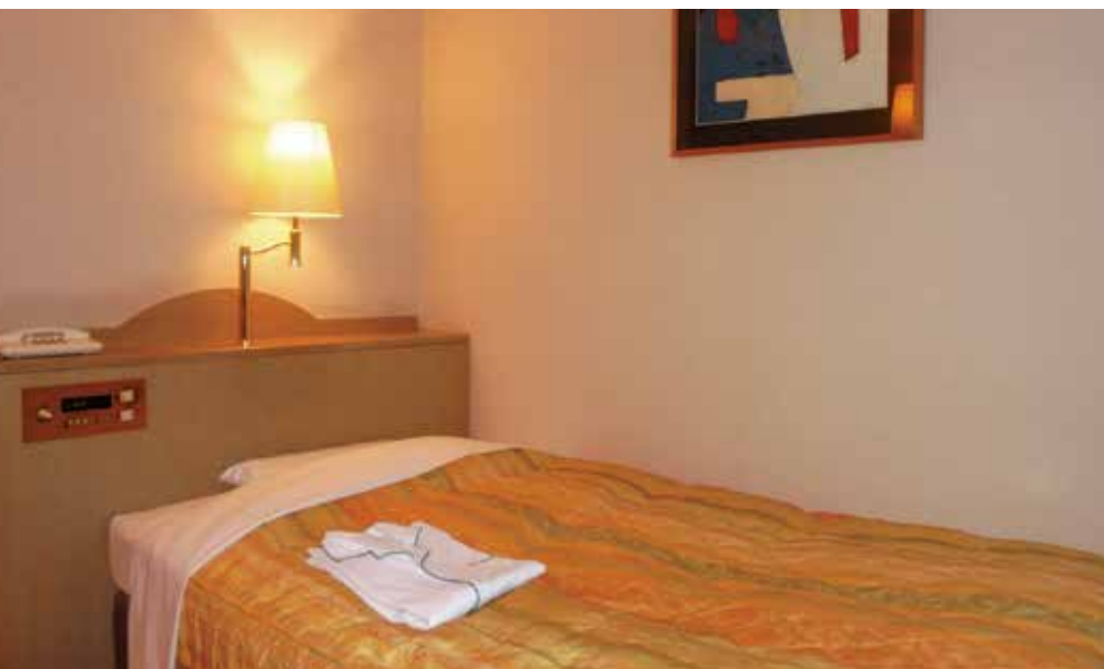
スタンダードシングルルーム