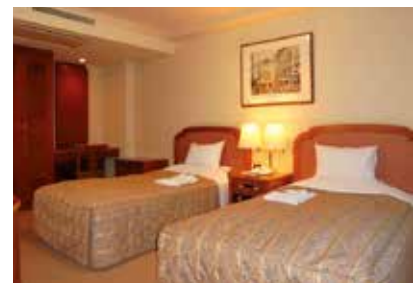
デラックスツインルーム