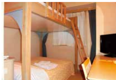
ファミリー2段ベッドルーム