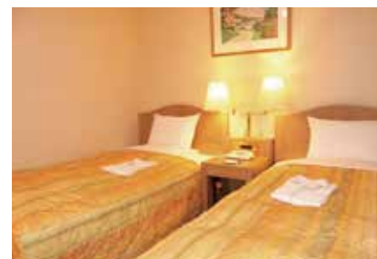
スタンダードツインルーム