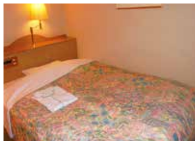
デラックスシングルルーム